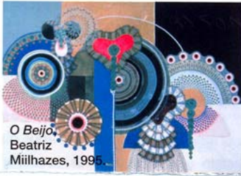
O Beijó , Beatriz Miihazes, 1995.

2 ARTE CONTEMPORÁNEO Collecting Contemporary (Taschen) de Adam Lindemann es un interesante libro que te enseñará todo lo que siempre quisiste saber sobre el arte contemporáneo. Contiene capítulos con líneas del tiempo de las más importantes ferias y exhibiciones, además de un glosario de términos. Una parte del libro está dedicada a entrevistas exclusivas con los protagonistas del mercado del arte, que van desde críticos, comerciantes y coleccionistas, hasta curadores y directores de museos. El texto está increíblemente ilustrado por la obra de grandes artistas como Jean-Michel Basquiat, Jeff Koons, Takashi Murakami, Cindy Sherman y Andy Warhol, entre otros. Sin lugar a dudas, debes añadir este libro a tu lista.