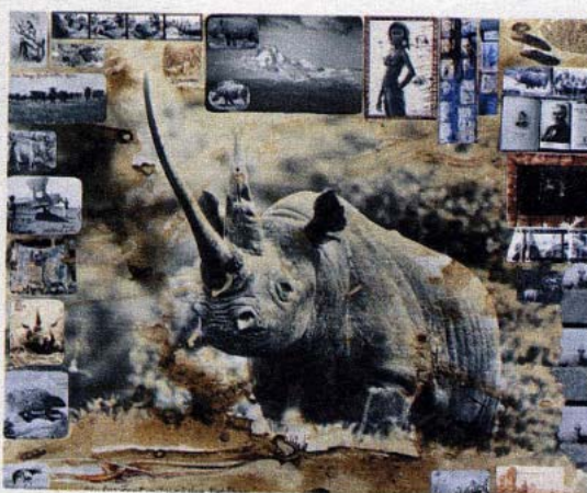
Opere di Beard. Da sinistra: Kenya, 1987; lago Rudolph, 1987; foresta Aberdare, 1972. Sotto: l'artista nel 1966

Erano semplicemente troppi. Si trattava di un problema di sovrappopolazione, lo stesso che ancora affligge tutta l'Africa».