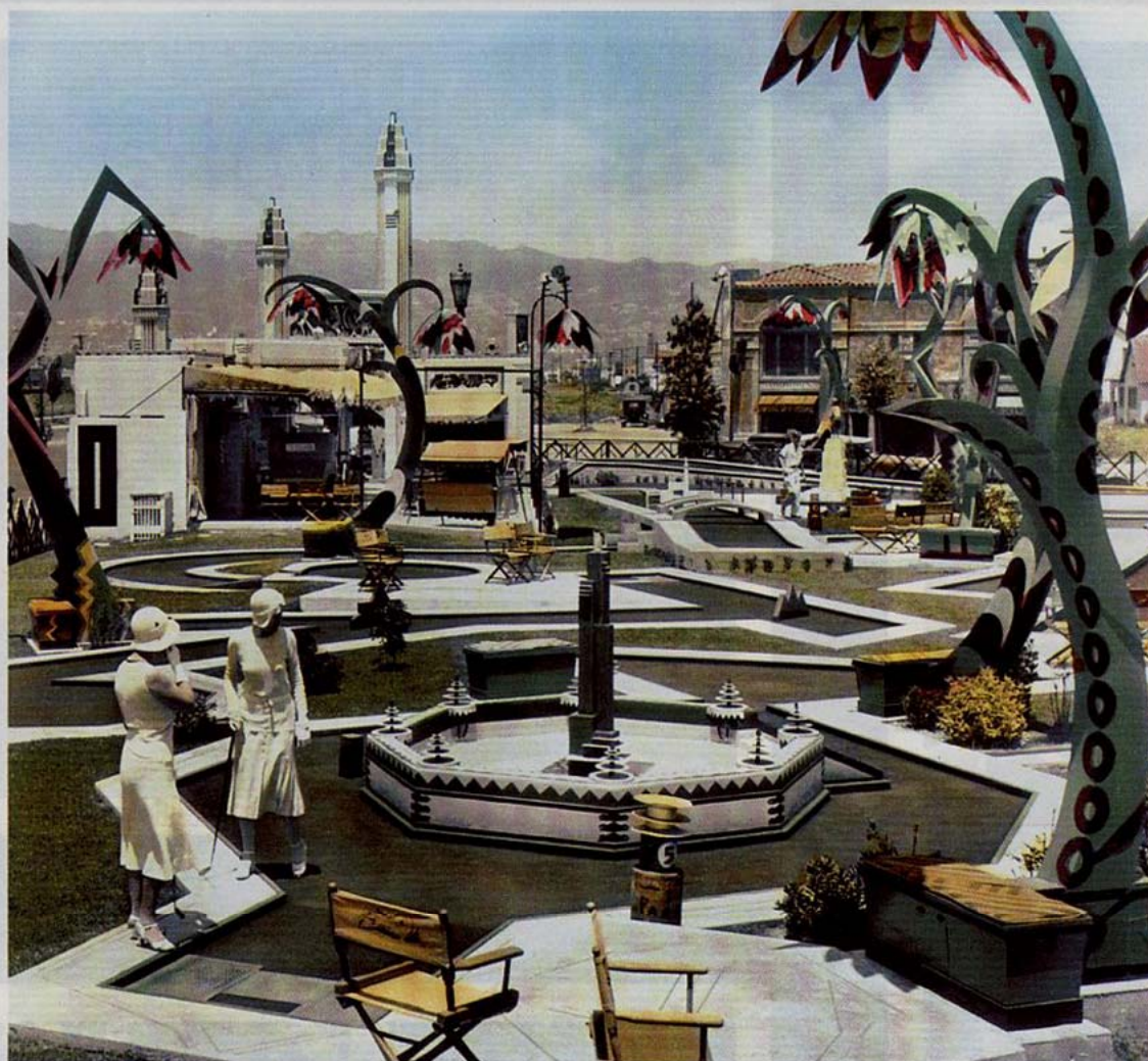
> DONNE AL MINIGOLF > Beverly Hills (California), 1931.