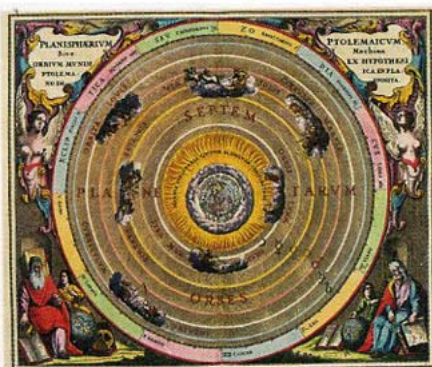
Cellarius: handkolorierte Himmelskarte