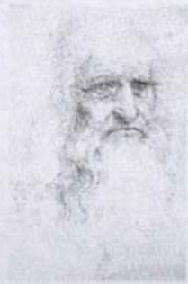
Todgeweiht: Selbstbildnis von 1519