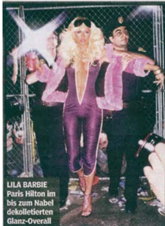
LILA BARBIE Paris Hilton im bis zum Nabel dekolletierten Glanz-Overall