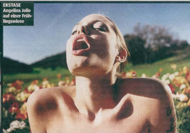
EKSTASE Angelina Jolie auf einer Früh- lingswiese