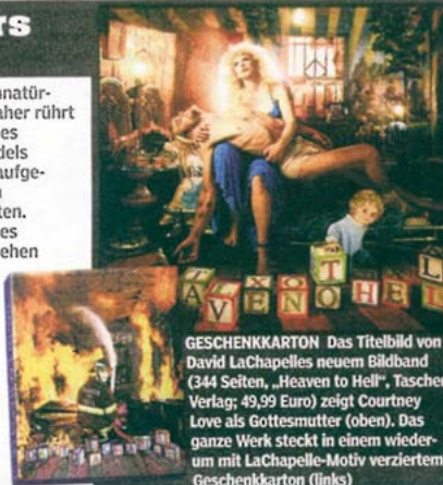
GESCHENKKARTON Das Titelbild von David LaChapelles neuem Bildband (344 Seiten, „Heaven to Hell“, Taschen Verlag; 49,99 Euro) zeigt Courtney Love als Gottesmutter (oben). Das ganze Werk steckt in einem wiederum mit LaChapelle-Motiv verziertem Geschenkkarton (links)

eine extreme Unnatürlichkeit. Wohl daher rührt David LaChapelles Vorliebe für Models mit übermäßig aufgespritzten Lippen und Silikonbrüsten. Wer die Bilder des Foto-Stars live sehen möchte: Am Samstag eröffnet im Berliner „Museum für Fotografie“ die LaChapelle-Ausstellung „Men, War & Peace“ (bis 20. Mai 2007).