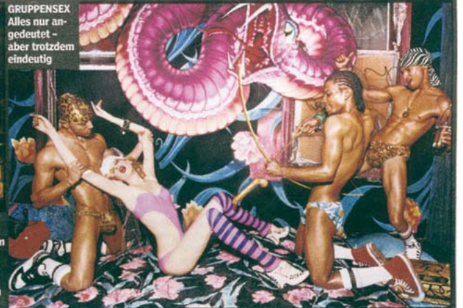
GRUPPENSEX Alles nur angedeutet – aber trotzdem eindeutig