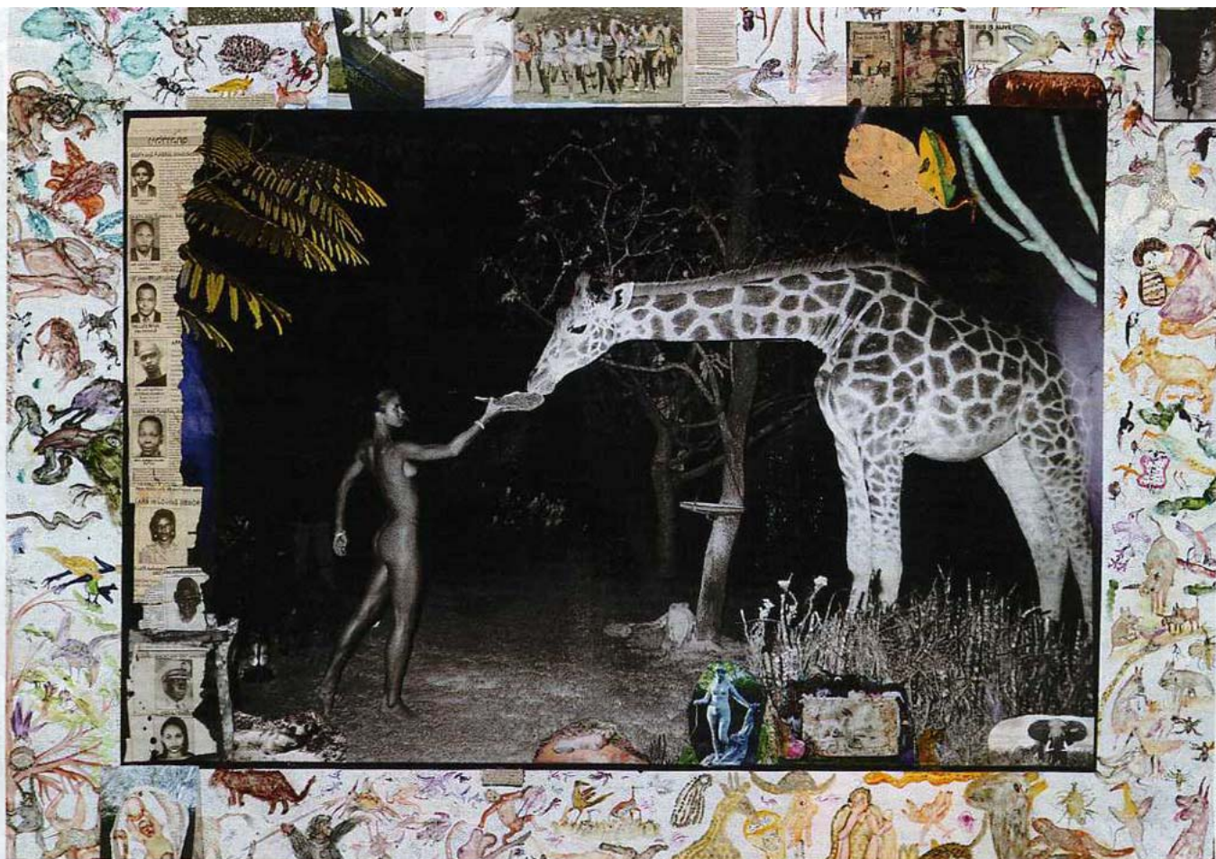
Beard-Arbeit „Maureen and Late-Night Feeder“ (Kenia, 1987): Gleichnisse für die kaputte zivilisierte Welt