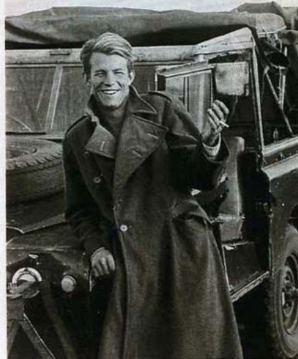
Fotograf Beard 1966, 2004*: Bronzestatue mit Denkvermögen