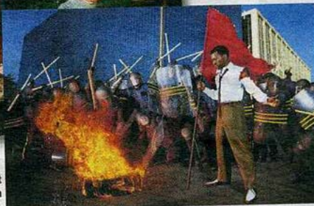
Den Rapper Kanye West setzte LaChapelle in Revolutionspose.

David LaChapelle – wenn Kommerz und Pornografie in der Fotografie zusammenkommen