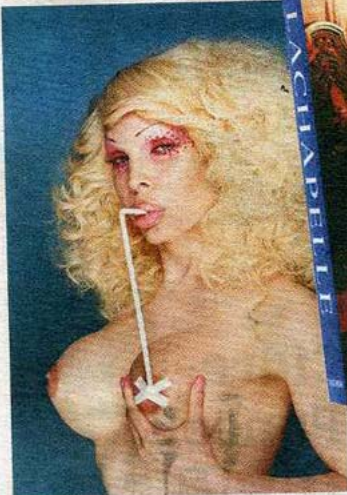
LaChapelles ständige Muse: Die Transsexuelle Amande Lepore.