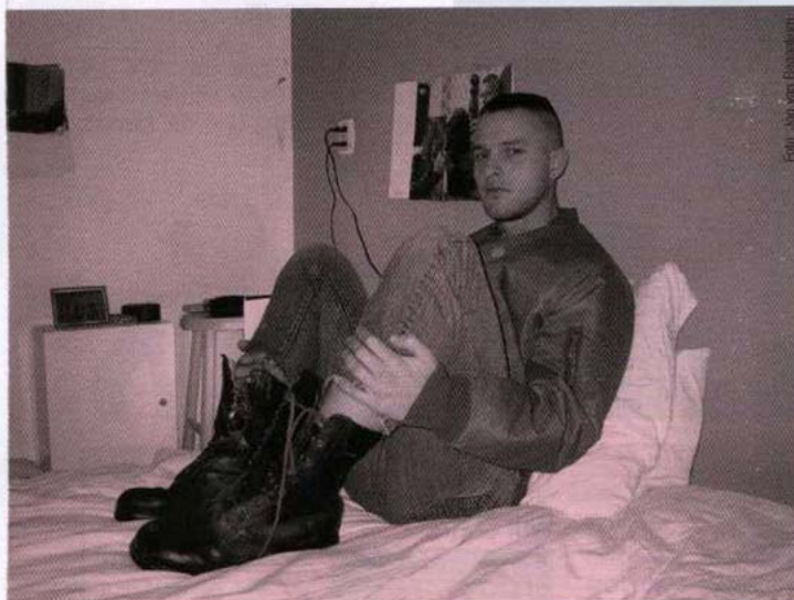
David Beckhams legendäre Fotostrecke für das Modemagazin 'Arena Homme Plus' wurde für die erste Ausgabe des Butt-Magazins als 'We want it Beck!' nachgestellt. (links)

Das Butt-Magazin erscheint vierteljährlich und ist in ausgewählten Kunstbuchhandlungen und allen American Apparel-Shops für 7,50 EUR erhältlich. Checkt www.buttmagazine.com