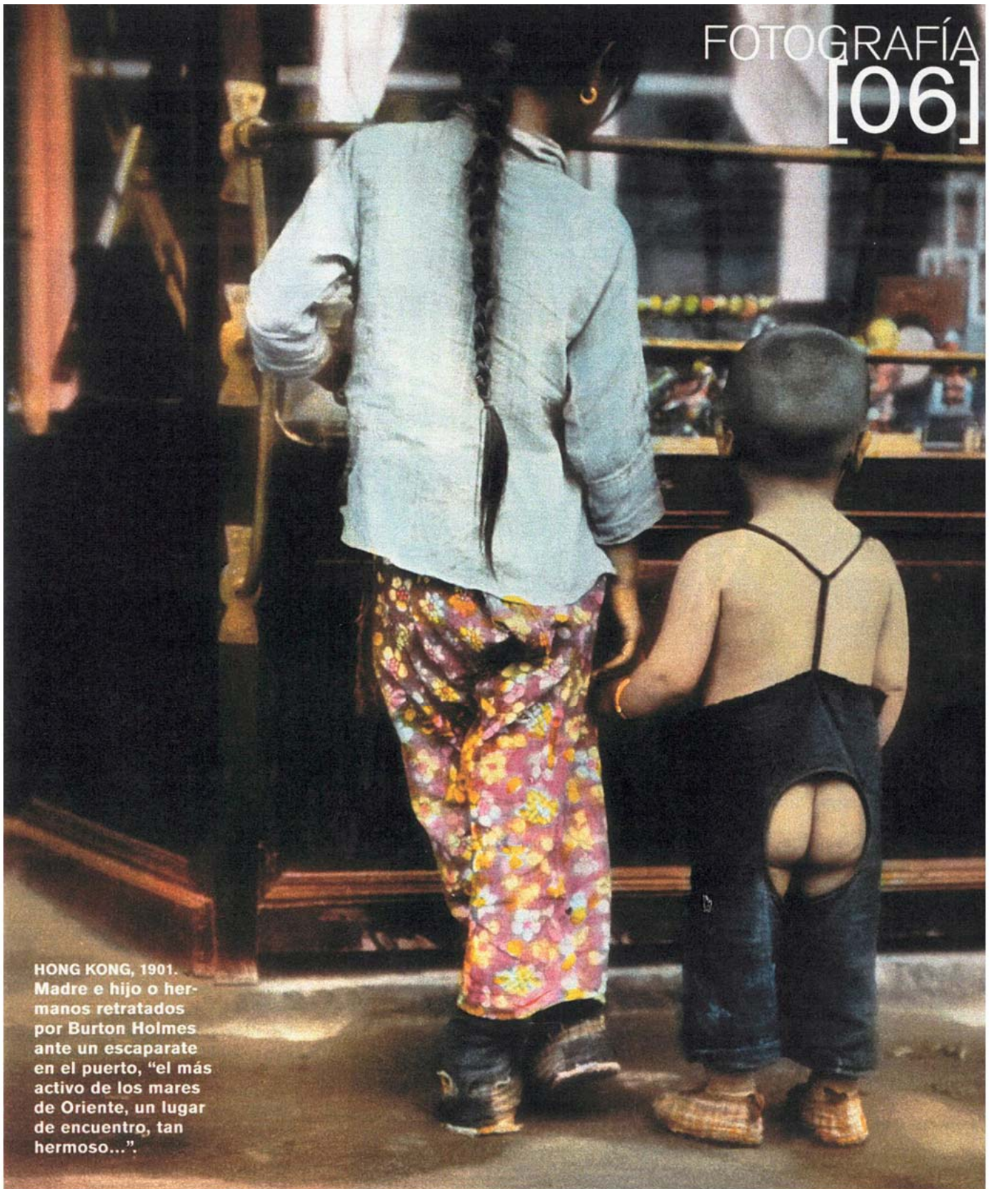
HONG KONG, 1901. Madre e hijo o her- manos retratados por Burton Holmes ante un escaparate en el puerto, "el más activo de los mares de Oriente, un lugar de encuentro, tan hermoso...".