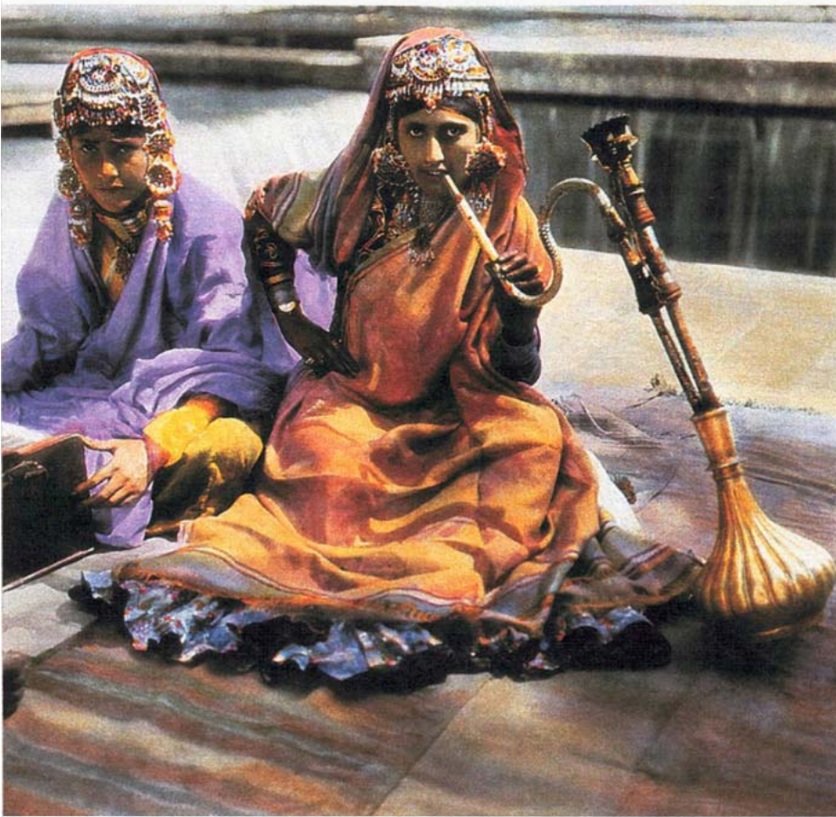
FESTIVALES Y PLAYAS. 'Espectadoras de un festival religioso en Delhi', fechada en 1912. Debajo, imagen titulada 'Niño sobre una tortuga en la isla de Java', 1932.