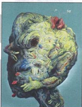
The Hinterland , 2006 - ©Brown, Glenn