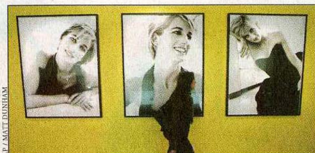
Unveröffentlichte Bilder von Starfotograf Mario Testino, zu sehen im Kensington Palast und im Buch zur Ausstellung

Für Testino war dieses Bedeutende wohl diese Begegnung, die ihn vom begehrten Modelfotografen zum Starfotografen beförderte, wie er selbst sagt: „Da rackert man sich fünfzehn Jahre lang ab, und wegen einer einzigen Sache kennt einen dann plötzlich die ganze Welt.“