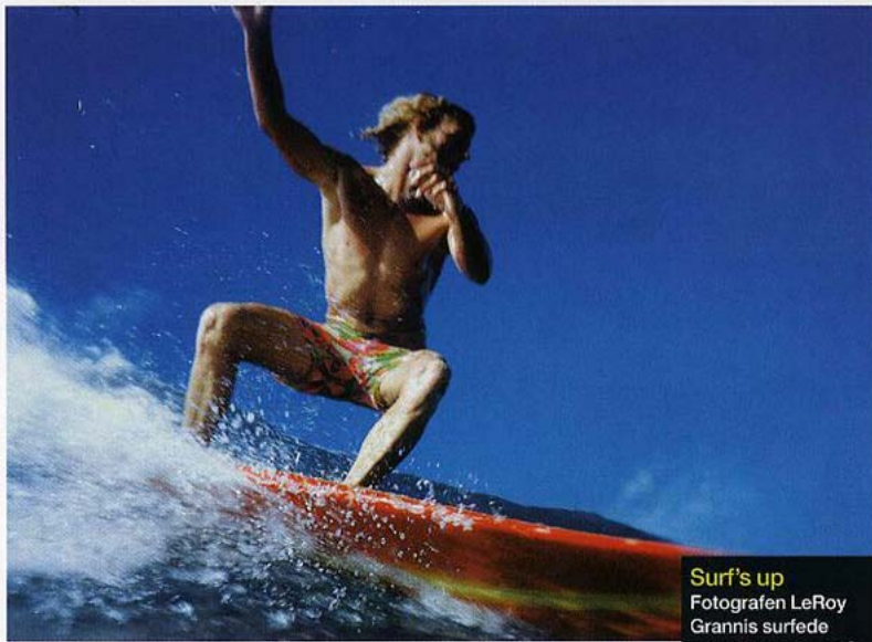
Surf's up Fotografen LeRoy Grannis surfede selv, til han var 80 år