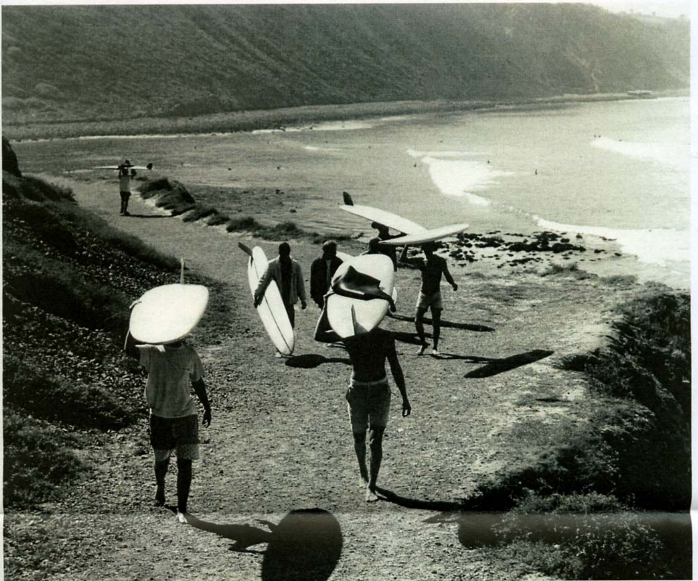
LEROY GRANNIS, PALOS VERDES COVE, 1964