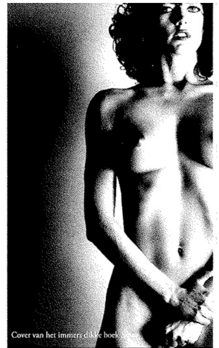
Cover van het immers dikke boek

Qua stijl, die in Newtons geval meestal niet even lichtvoetig, zeg maar gerust duister was (ondanks de humor die er vaak in zat), was Newton vooral beïnvloed door het surrealistische van de Duitse documentairefotograaf Erich Salomon en de Hongaars-Franse fotograaf Brassai, met wie Newton