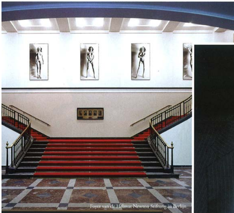
Foyer van de Helmut Newton Stiftung in Berlijn