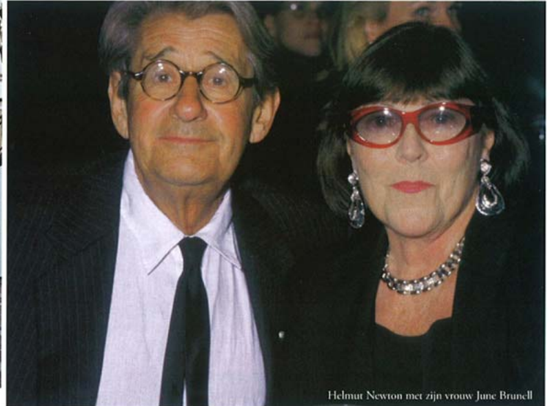
Helmut Newton met zijn vrouw June Brunell

In een interview met het populaire online magazine Salon.com zei ze over hun relatie: 'Helmie is voor mij niet de man die iedereen kent van zijn werk. Dat is zijn duistere kant, met mij is hij altijd heel liefdevol.' En in een ander interview, in Radar Magazine : 'Nee, ik heb er nooit problemen mee gehad dat hij andere vrouwen naakt fotografeerde. Sterker nog, het is geweldig om de vrouw te zijn van iemand die zulke krachtige erotische foto's maakt. Ik heb me maar één keer echt zorgen gemaakt, dat was toen hij bloemen begon te fotograferen. Nee, hij maakte al foto's van vrouwen toen ik hem leerde kennen en ik hoop dat hij dat tot zijn dood blijft doen.'