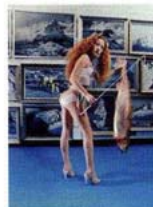
Devon Aoki, 1998