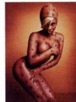
Lil' Kim, 2000

RESTIR TOKYO & RESTIR.COM 東京都中央区銀座4-2-2 ☎03-5159-0595