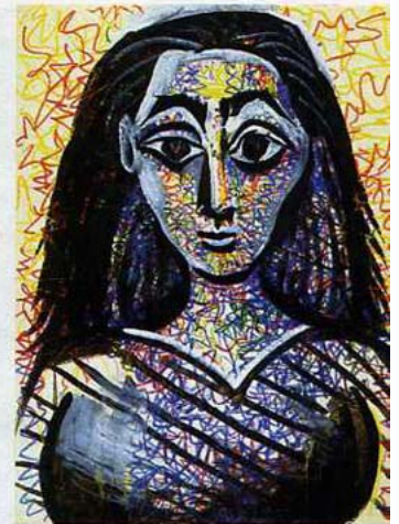
Spitzen-Picasso Gouache „Tête de femme (Jacqueline)“, 1957, Galerie Landau, 4,2 Mio. Dollar

Der Umsatz der Messe liegt – nach Schätzungen der „New York Times“ – bei 200 bis 300 Millionen Dollar. Doch vieles, was die mehr als 290 Galerien aus aller Herren Länder auf dem Kunstmarkt präsentieren, wechselt schon vor der Messe den Besitzer. Der millionenschwere Picasso „Homme assis (Musketier)“ ▶