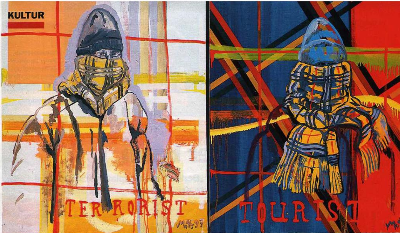
Highlight Martin Kippenbergers „Terrorist/Touristin“, 1997, auf der Art Basel bei Acquavella aus New York. Preis: um 1 Mio. Dollar