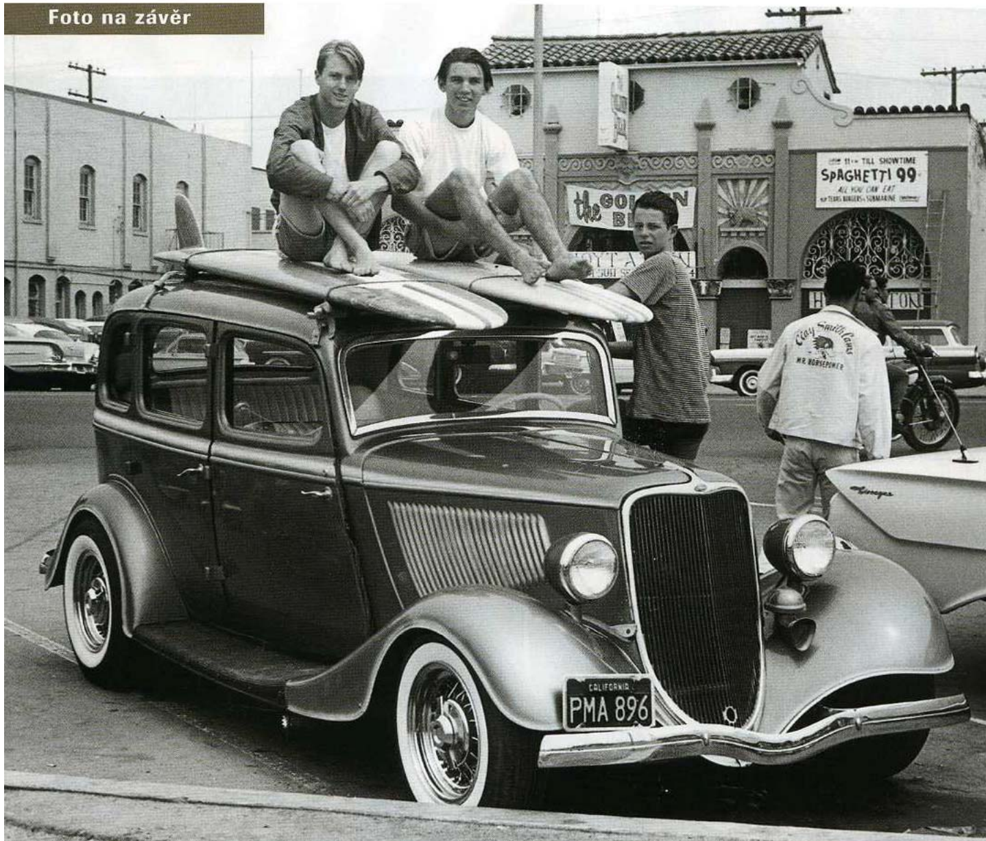
Huntington Beach, 1964. Mladí surfaři přijíždějí sledovat slavné mistrovství Spojených států 1964. Jejich automobil je dokonale restaurovaný Ford Deluxe z roku 1933, tedy model, který používal i známý zločinec John Dillinger. Fotografie pochází z knihy: LeRoy Grannis, „Surf Photography of the 1960s and 1970s“. Kniha, vyšla v nakladatelství Taschen ve sběratelské, limitované edici 1000 výtisků. Popisuje a hlavně zobrazuje bouřlivý nástup surfování, které se stalo na Havaji a rychle nato i ve vlastních Spojených státech životním stylem