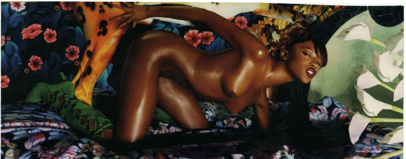
Naomi Campbell (1998)