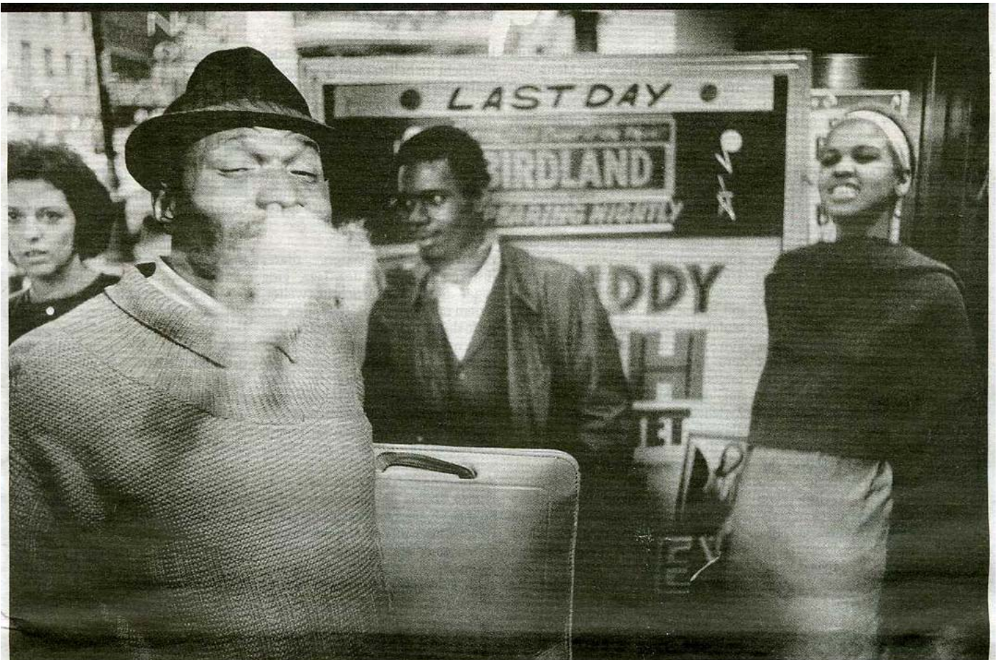
Schall und Rauch. Schlagzeuger Elvin Jones vor dem weltberühmten Jazzclub «Birdland» in Manhattan, New York City.