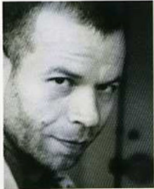
Wolfgang Tillmans, Jahrgang 68, fotografierte nach dem Abitur u. a. für Prinz und Tango, studierte in den goziger Kunst und Design in England. Turnerpreisträger 2000. Mit 29 Gastprofessur in Hamburg und seit 2003 Professor für Interdisziplinäre Kunst an der Städelschule in Frankfurt. Wolfgang Tillmans, born in 1968, photographed for Prinz and Tango after finishing high school. He studied art and design in London in the nineties and won the Turner prize in 2000. At 29 years of age he was a guest professor in Hamburg and since 2003 is professor for interdisciplinary art at the Städelschule in Frankfurt.