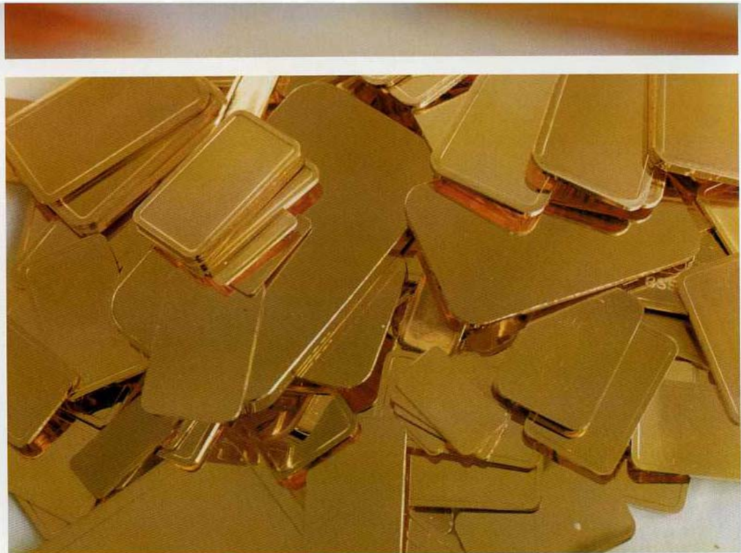
»Gold (c)«, 2002; »Gold (d)«, 2002