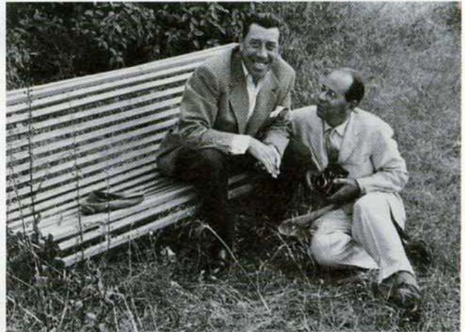
Fernand Joseph Désiré Contandin alias Fernandel (1903–1971) mit Philippe Halsman (1906–1979) // Fernand Joseph Désiré Contandin aka Fernandel (1903–1971) with Philippe Halsman (1906–1979)

Ein Mann mit einem sprechenden Gesicht ist ein Glücksfall für einen Fotografen. Das war dem Lichtbildner Philippe Halsman, einem gebürtigen Letten, sofort klar, als er Fernandel 1948 in New York traf. Er arrangierte ein Interview mit dem Schauspieler, in dem die Stärken der beiden Männer voll zur Geltung kamen: Fernandels mimisches Genie und Halsmans Geschick, Psychologie fotografisch auf den Punkt zu bringen. Ein Zwiegespräch ohne Worte, zumindest auf der einen Seite. Der Fotograf lieferte die Stichworte, Fernandel antwortete beredt, aber stumm – und beim Betrachter des Bildes entsteht der Eindruck: Dieses Gesicht ver-rät einfach alles. Das tut es natürlich nicht: Es sagt exakt das, was es sagen soll – schließlich ist es das Instrument, auf dem ein Virtuose spielte.