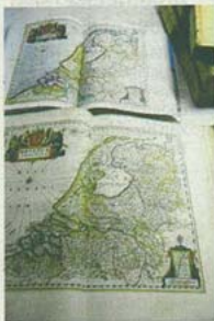
Kaart van Nederland in de oude (onderaan) en nieuwe uitgave. FOTO'S MARC VAN DER KORT; ILLUSTRATIES NATIONALE BIBLIOTHEEK WENEN