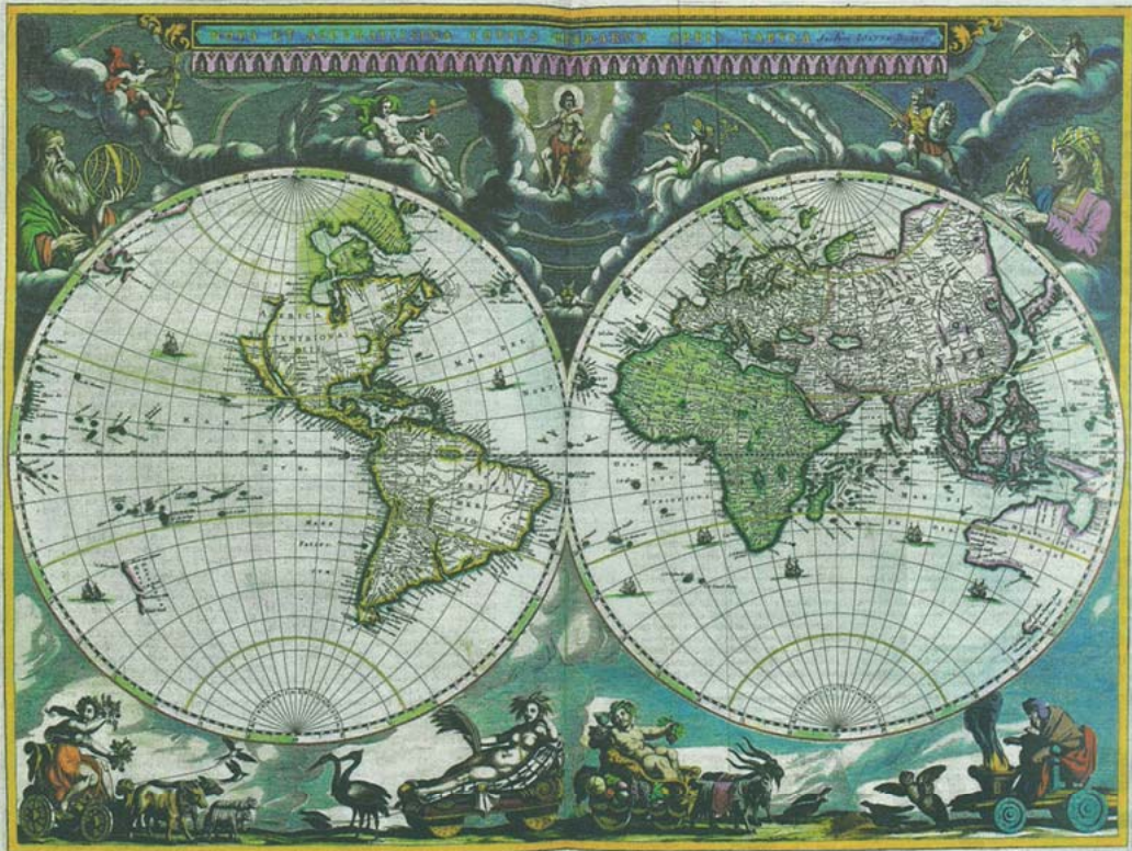
Nieuwe en zeer nauwkeurige wereldkaart. Met bovenaan portretten van Copernicus en Ptolemaeus en een voorstelling van het zonnestelsel. Onderaan de allegorische voorstelling van de vier seizoenen.

In Onze Drukkerij , Joan Blaeu, 1 januari 1665.