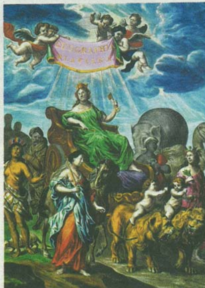
Titelpagina geographia Blaviana, ofwel de geografie van Blaeu. Moeder aarde Cybele is te zien, met naast de wagen de personificaties van de vier continenten.

Het centrum van de wereld. Dat was Amsterdam in de zeventiende eeuw, zeker op het gebied van landkaarten en atlanten. Zonder concurrentie. De Atlas Maior vormde het sluitstuk van een periode.