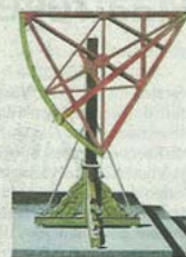
Astronomisch sextant voor het meten van de hoogte van de zon, maan, planeten en sterren. Ontworpen door Tycho Brahe, gebouwd omstreeks 1576.