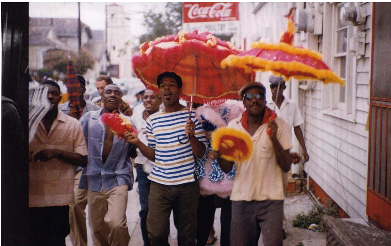
"En Nueva Orleans, los second liners ; unos tipos duros que llevaban paraguas de marabú, se unieron al cortejo fúnebre para participar en un duelo del que se habían desterrado las lágrimas"