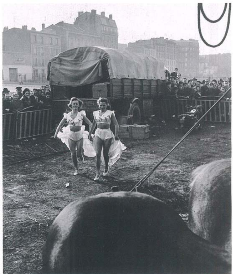
▼ Les écuyères du Zoo-Circus, Ivry-sur-Seine, 1949