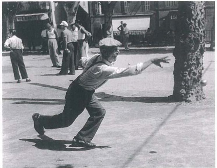
▲ Pétanque, Aubagne, 1947

"Willy Ronis" par JC Gaubrand, 192 p., 20 € aux éditions Taschen. Exposition à la galerie Camera Obscura jusqu'au 15 octobre, à l'Hôtel de Ville de Paris jusqu'au 31 janvier et participation avec 18 photos à l'exposition "3 photographes humanistes" au Musée Carnavalet (Paris) jusqu'au 15 janvier 2006.