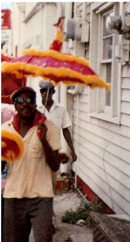
ein Ausbruch von Ausgelassenheit und Lebensfreude

Orleans. Überall ist New Orleans. Hier hat alles angefangen, von hier aus hat Jazz die Welt erobert. Der Bildband „Jazzlife“, in den sechziger Jahren erschienen, hat den Mythos dieser Stadt mit geprägt. Mit rund zwei Millionen verkauften Exemplaren gilt er als erfolgreichstes Musikbuch aller Zeiten. Die dicke, schwere Neuauflage – XXL-Format, üppig bebildert, prachtvoll ausgestattet, sogar eine CD mit Aufnahmen aus Berendts Archiv liegt bei – ist Reminiszenz und Trost zugleich: Jazz lebt.