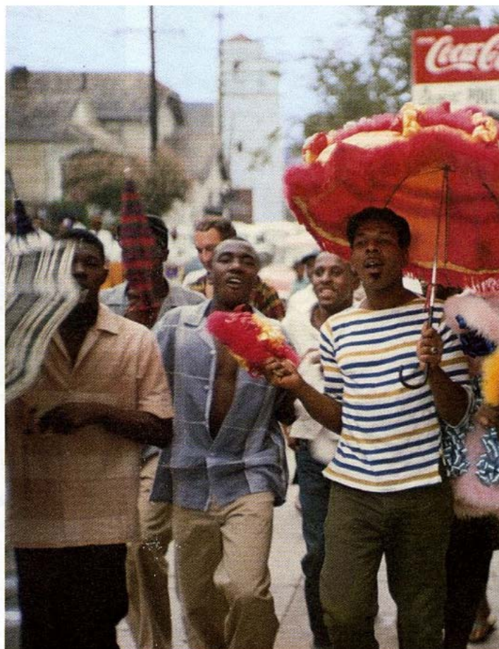
Prozession nach einer Beerdigung in New Orleans: Der Klage auf dem Friedhof folgt