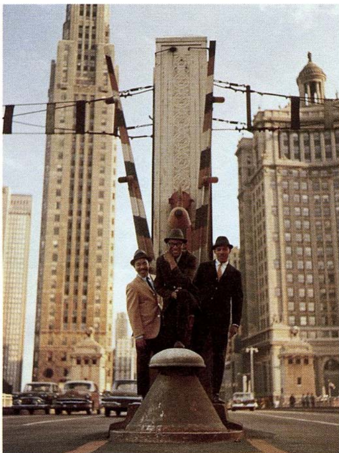
Das Ramsey Lewis Trio, fotografiert auf einer Verkehrsinsel in Chicago