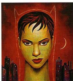
Illustration Now! Taschen

Зачем нужны иллюстрации, если есть фотография? Начинаящий бильд-редактор так и размышляет. Он со знанием дела назначает съемки и покупает архивные сним-