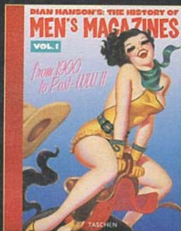
History of Men's Magazines Vol. 1 (de 1900 à la Seconde Guerre mondiale) réf : 3-8228-2229-9 – 40€

History of Men's Magazines Couverture rigide / 21.3x27.7 cm / 460 pages L'histoire illustrée et annotée (textes en anglais et français) de la presse masculine internationale. Une magnifique série en plusieurs tomes. Des centaines de photos et de couvertures. La parfaite encyclopédie du collectionneur ! Volumes 5 et 6 à paraître fin 2005.