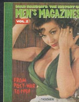
History of Men's Magazines Vol. 2 (de l'après-guerre à 1959) réf : 3-8228-2625-1 – 40€

History of Men's Magazines Couverture rigide / 21.3x27.7 cm / 460 pages L'histoire illustrée et annotée (textes en anglais et français) de la presse masculine internationale. Une magnifique série en plusieurs tomes. Des centaines de photos et de couvertures. La parfaite encyclopédie du collectionneur ! Volumes 5 et 6 à paraître fin 2005.