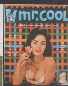
History of Men's Magazines Vol. 3 (les années soixante 1ère partie) réf : 3-8228-2976-5 – 40€