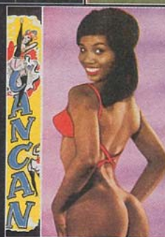
History of Men's Magazines Vol. 4 (les années soixante 2ème partie) réf : 3-8228-3635-4 – 40€