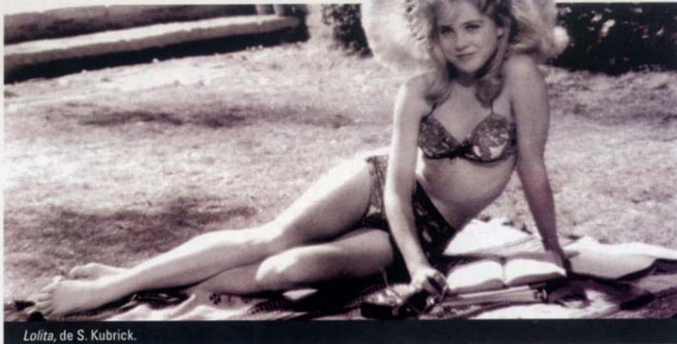
Lolita, de S. Kubrick.