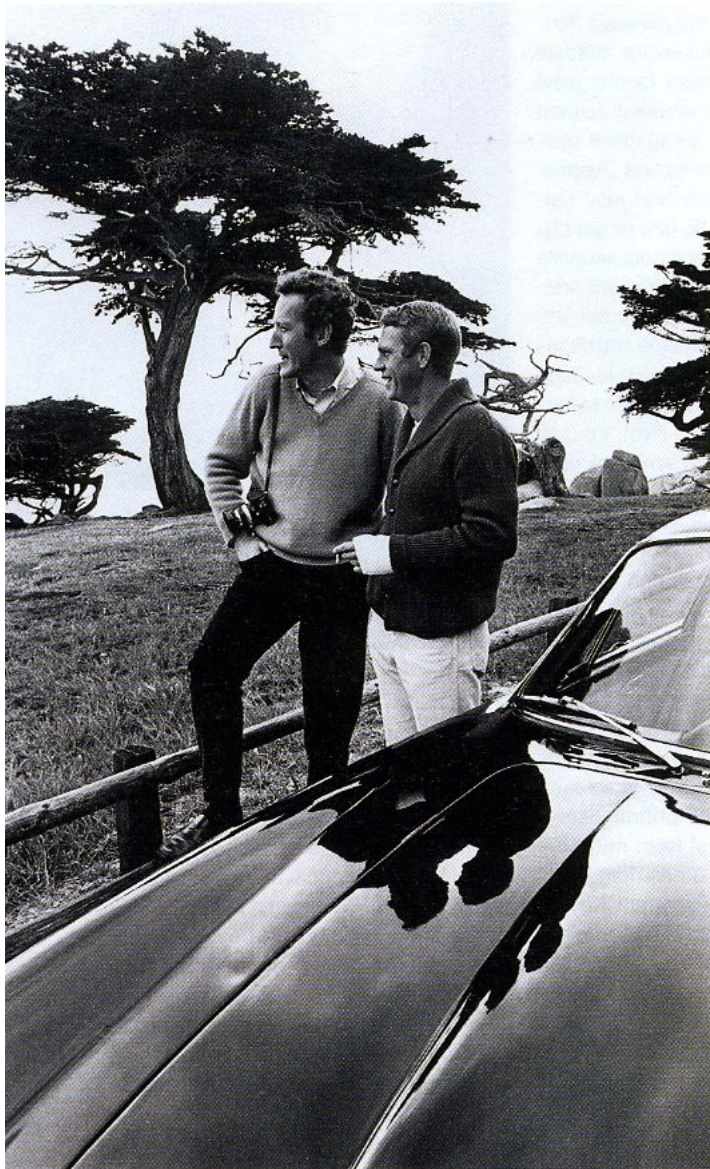
William Claxton a Steve McQueen na společné fotografii z knihy „Steve McQueen“