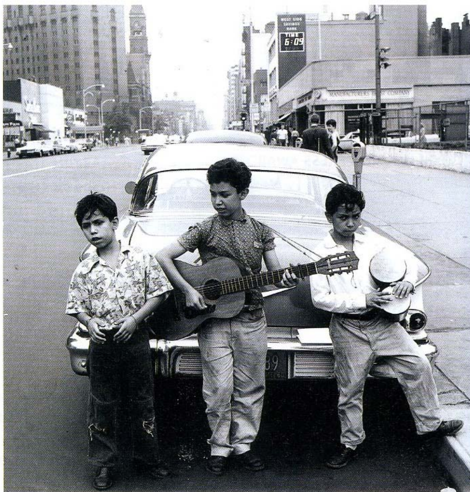
Budoucí džezoví muzikanti, Greenwich Village, New York City

Počátkem šedesátých let jsem stále více fotil pro magazín Life. A protože jsem bydlel v L. A., většina zakázek, které jsem od časopisu měl, se týkala Hollywoodu. Jednou mě požádali, zda bych nemohl nafotit seriál portrétů Natalie Woodové. Pamatuji se, že to bylo ve čtvrtém ateliéru studií Paramount, kde jsem se sešel s producentem Alanem Pakulou, režisérem Robertem Mulliganem a hvězdami jejich nového filmu Natalií Woodovou a Stevem McQueenem. Film se jmenoval Muž, o němž nic nevím. Uprostřed prázdného velkého zvukového ateliéru seděli tihle čtyři kolem stolu a diskutovali právě o kostýmech. Podal jsem si nejdříve ruku s Natalií Woodovou a hned na první pohled mi bylo jasné, že se spřátelíme. Když jsem se obrátil k jejímu partnerovi, McQueen mi ruku nepodal, jen mě upřeně pozoroval svými ocelově modrými očima. (Později mi řekl: „Claxi, tím pohledem jsem tě tenkrát dostal, co?“) Jeho pohled byl tak mrazivý, až jsem měl pocit, jako by mě ve zlomku vteřiny pro-