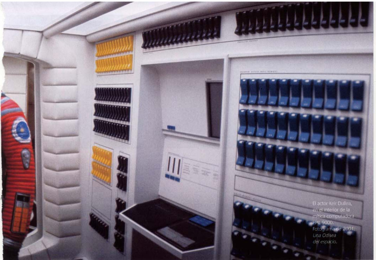
El actor Keir Dullea, en el interior de la mítica computadora HAL 9000. Fotograma de 2001: Una Odisea del espacio.