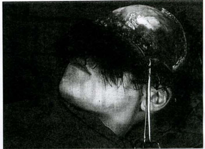
Augen zu und durch: Beim Stirnlifting wird die ganze Stirnhaut heruntergeklappt.