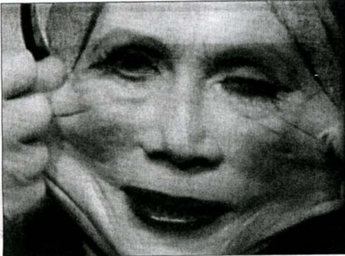
Die Operation als Farce: In Terry Gilliams Film «Brazil» gehts ganz schön zur Sache.

Der Band «Schönheitschirurgie» geht über die Freakshow weit hinaus und hat das Zeug zum Standardwerk.