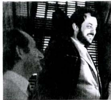
Stanley Kubrick on set von «2001: A Space Odyssey» - Im begehbaren Innern des Supercomputers HAL oder so, wie er sich die Zukunft der Computer vorstellte. HAL würde heute in einen Laptop passen. Stanley Kubrick on the set of «2001: A Space Odyssey» - Inside the interior of the super computer HAL, as Kubrick imagined a computer would look like in the future. Today HAL would fit inside a laptop.