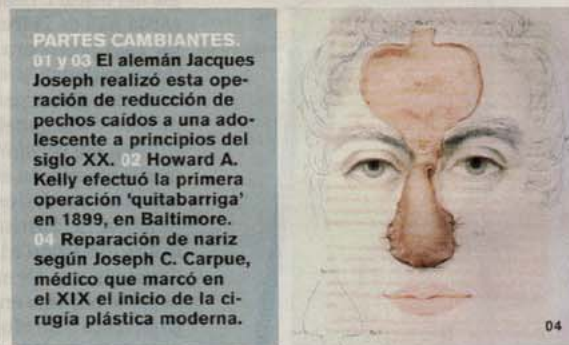
PARTES CAMBIANTES. 01 y 03 El alemán Jacques Joseph realizó esta operación de reducción de pechos caídos a una adolescente a principios del siglo XX. 02 Howard A. Kelly efectuó la primera operación 'quitabarriga' en 1899, en Baltimore. 04 Reparación de nariz según Joseph C. Carpue, médico que marcó en el XIX el inicio de la cirugía plástica moderna.