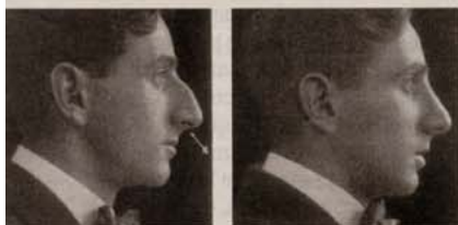
SIGNOS DEL GRUPO, DE LA RAZA. Las mujeres iraníes se operan cada vez con mayor frecuencia aquello que pueden enseñar: el rostro. Y de éste, especialmente la nariz. Una más occidental garantiza, creen, mayor éxito. Los judíos se modificaban la nariz ya en el siglo XIX para pasar inadvertidos.

Los hacedores. "No opero sólo el cuerpo, sino también el alma", asegura el brasileño Ivo Pitanguy, el llamado "Miguel Ángel del bisturí", en una de las entrevistas a cirujanos famosos incluidas en el libro. "Hablamos con 40 de ellos en todo el mundo. Queríamos saber qué entienden por belleza y edad; si creen que la belleza es meramente exterior; si una persona mayor puede ser guapa con arrugas; qué personas, qué obras de arte consideran hermosas; si se tienen por artistas, y cómo ven el futuro de la cirugía estética". La sorpre-