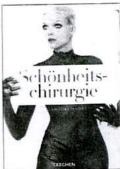
Das Buch „Schönheitschirurgie“ ist aufwändig in Seide gebunden und kostet 39,99 Euro. Herausgeberin: Angelika Taschen , Taschen-Verlag.

Aber wer macht sich bei seinem Traum von Schönheit schon wirklich klar, was ihn auf dem OP-Tisch erwartet?