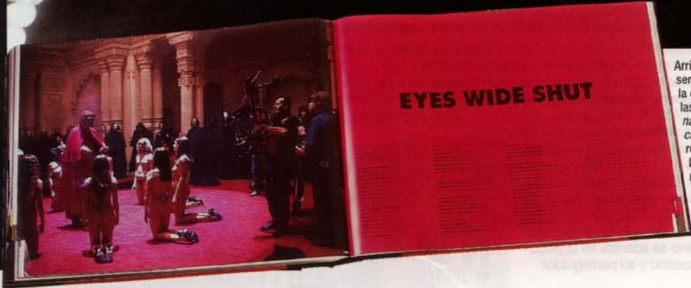
Arriba, Stanley observa a través de la cámara una de las escenas de La naranja mecánica . Izquierda, el rodaje de Eyes Wide Shut , la última creación del director.

“ SI ALGO PUEDE PENSARSE O ESCRIBIRSE ¡SE PUEDE FILMAR! ”