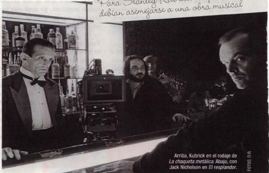
Arriba, Kubrick en el rodaje de La chaqueta metálica . Abajo, con Jack Nicholson en El resplandor .