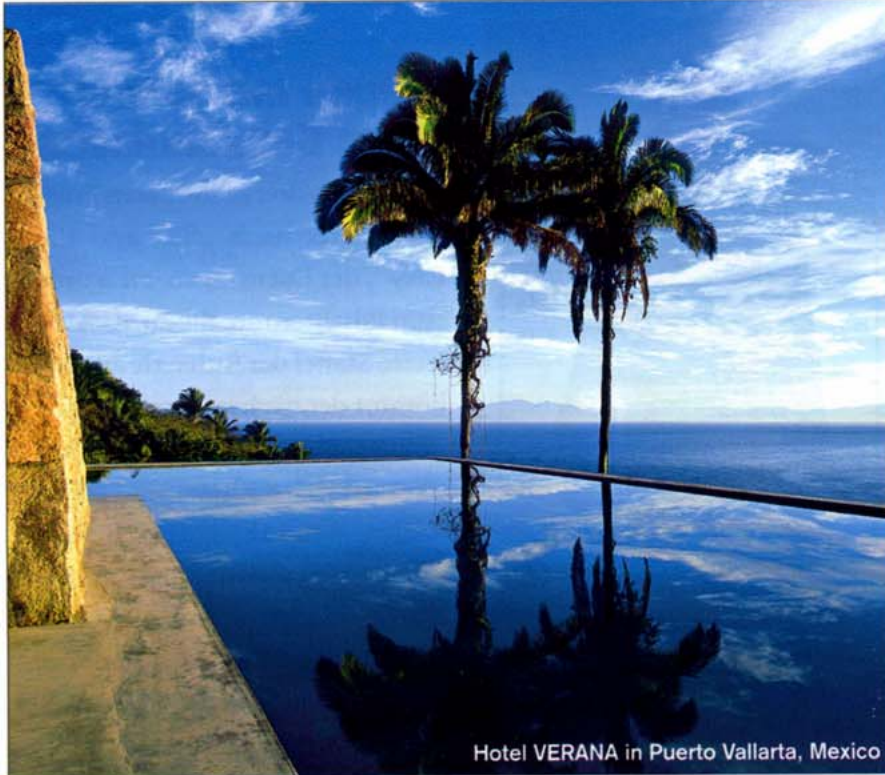
Hotel VERANA in Puerto Vallarta, Mexico