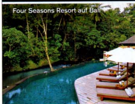
Four Seasons Resort auf Bali