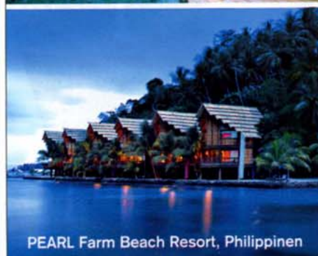
PEARL Farm Beach Resort, Philippinen