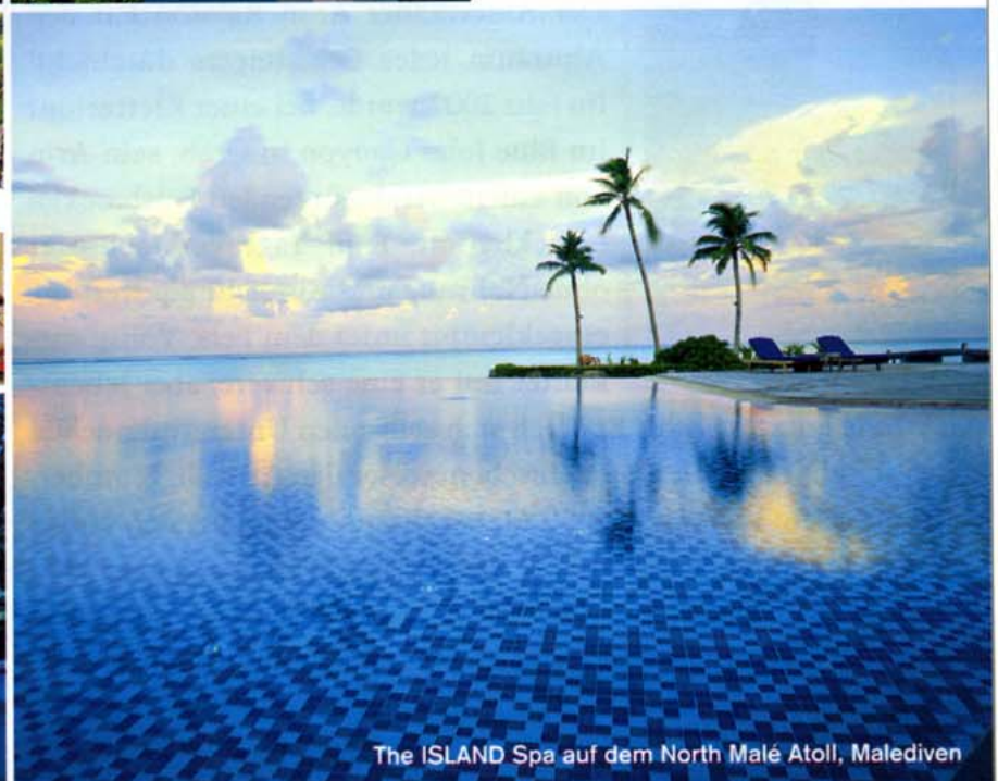
The ISLAND Spa auf dem North Malé Atoll, Malediven