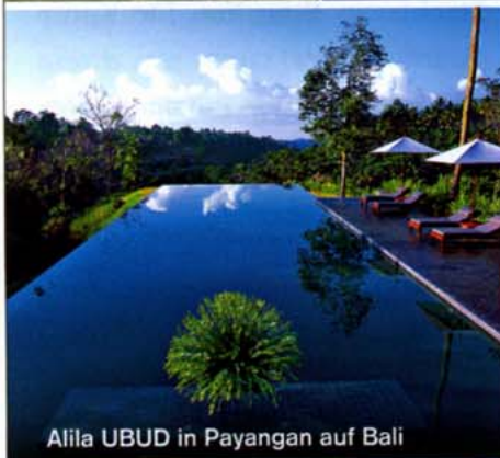
Alila UBUD in Payangan auf Bali