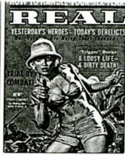
•Real, 1962. zlg