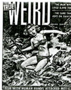
•Fish with human hands... 1955.