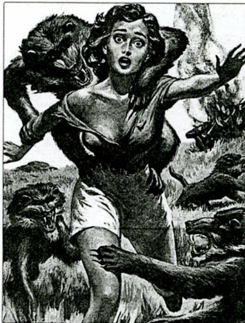
Schön noch in grösster Not: •Man's Life, 1963. zlg

Die diese gnadenlose Welt bevölkernden Damen mit oder ohne Retter sind zur Freude des Durchschnittsbürgers allesamt mit Russ Meyeresken Formen gesegnet – kaum vermögen die Blusen die frauliche Fülle zu bändigen. Nicht immer aber sind sie Opfer wilden Getiers, grausamer Folterknechte, in die Gegenwart einbrechender Himalaja-Schneemenschen oder Keulen schwingender Steinzeit-Wüstlinge. Nein, sie können auch als Piratenköniginnen an den Mast gebundene Muskelmänner blutig peitschen, als Voodoo-Priesterinnen Männerpuppen pieksen, als «man-killing girls of Lepu» Unschuldige mit Bambusrohren in den Tod prügeln oder als leichtgeschürzte MG-Schützinnen dem Feind Saures geben.