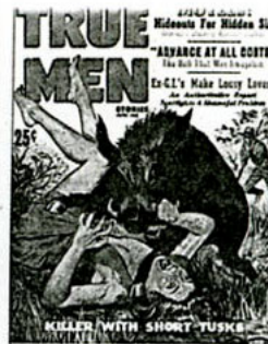
•True Men Stories, 1959. zlg