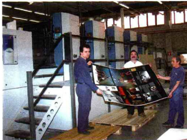
Cette commande exceptionnelle fut un grand défi pour les imprimeurs de Arti Grafiche LEVA