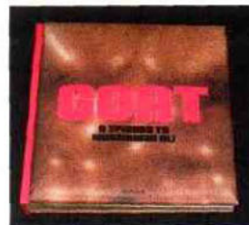
Exceptionnel, lourd et cher. GOAT, le livre-biographie de Mohammed Ali, lourd de 34 kg en format 50x50 cm, a été imprimé à un tirage strictement limité de seulement 11 000 exemplaires sur machines grand format KBA Rapida 162

saires pour l'impression et le vernissage. Plusieurs pages richement illustrées, d'innombrables photos inoubliables comme celles des championnats du monde de Kinshasa ou de Manille se déplient pour atteindre une largeur allant jusqu'à 1,5 m.