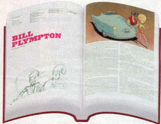
Verbetes: 576 páginas de informações sobre autores