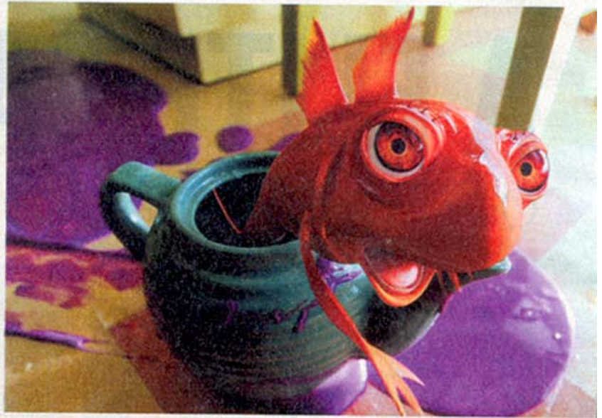
Estilos: os capítulos do livro registram diferentes técnicas de animação, como a computação gráfica do filme Cat in the Hat