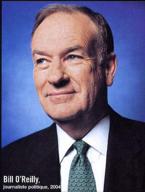
Bill O'Reilly, journaliste politique, 2004.