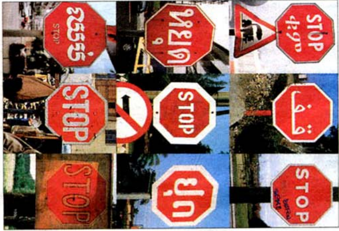
Stoppafel: In allen Sprachen achteckig