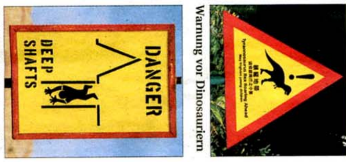
Gefahrenafel in Australien