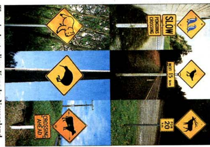
Tiere in Australien, Kanada, Neuseeland