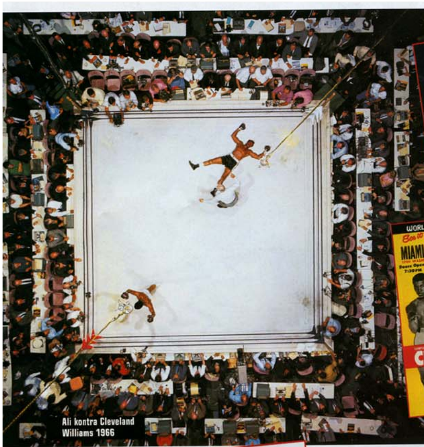
Ali kontra Cleveland Williams 1966