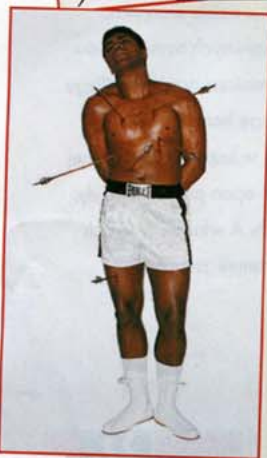
Zdjęcie z okładki Esquire'a 1968