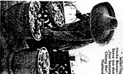
→ Jagen Tag hische Blumen Szene aus dem „Four Seasons Chong Mor“ Thailand

Thailand ist Sehnsucht, ist befeuert, erfüllt die Klischees eines Urlaubs. 3000 Kilometer von der brennenden Sonne der Karibik entfernt, ist Thailand zu einem der beliebtesten Touristenziele der Welt geworden. In Thailand ist die Natur so schön wie nirgendwo sonst. Die Landschaft ist ein Paradies für die Sinne. Die Landschaft ist ein Paradies für die Sinne. Die Landschaft ist ein Paradies für die Sinne.