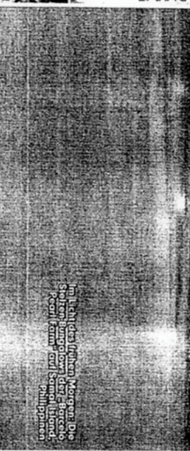
Im Licht des frühen Morgenlichts Sind die schönsten Bilder Reise in Kerala Philippinen

Asien News Mit Air Asia billig fliegen Bei der malaysischen Airline gibt es keine Papierflüge, keine kostenfreien Drinks oder Mahlzeiten, keine Sitzplatzreservierungen - dafür supergünstige Intra-Asienflüge. Z. B. ohne Lärmur-Bandung/Indonesien umgerechnet ca. 21,35 Singapur-Bangkok ca. 11,52 Euro. Infos: www.airasia.com