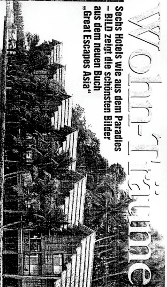
→ Jagen Tag hische Blumen Szene aus dem „Four Seasons Chong Mor“ Thailand

Sechs Hotels wie aus dem Paradies - BILD zeigt die schönsten Bilder aus dem neuen Buch „Great Escapes Asia“