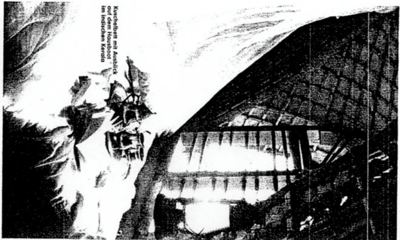
Kuchentanz mit Ausblick auf dem Fousabor im indonesischen Kerinci