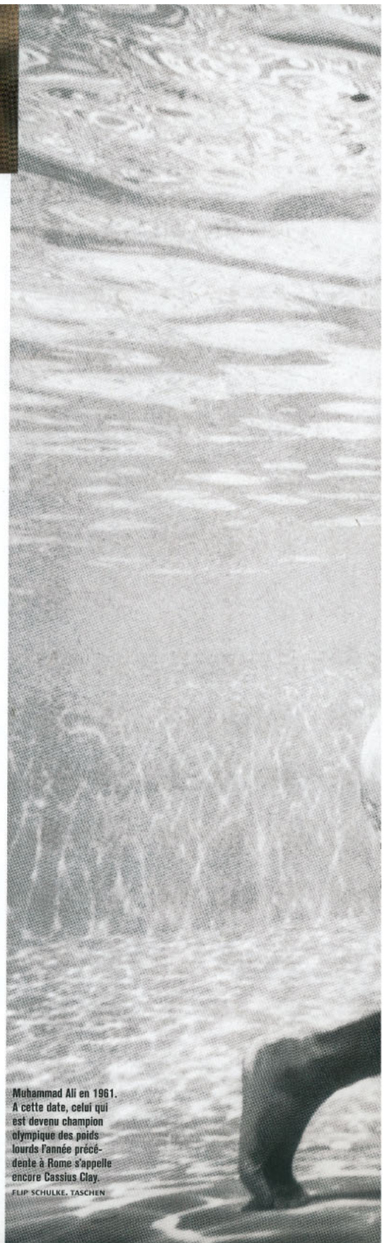
Muhammad Ali en 1961. A cette date, celui qui est devenu champion olympique des poids lourds l'année précédente à Rome s'appelle encore Cassius Clay.

Le projet a failli mal commencer. Benedikt Taschen avait eu la bonne idée d'envoyer Sumo à l'ancien boxeur, pour lui montrer ce qu'il était capable de faire. « Qui est ce type qui m'envoie un livre plein de filles nues ? » a été la première remarque de Muhammad Ali à son manager. Les choses se sont arrangées ensuite. Taschen a travaillé avec la femme du boxeur et son entourage proche. Le monument est plutôt hagiographique. Il raconte la légende. Mais elle est tellement photogénique et spectaculaire ! Benedikt Taschen a accompli sa mission. Quand il a vu le livre, Muhammad Ali a juste dit : « Je ne savais pas que j'étais si grand ! »