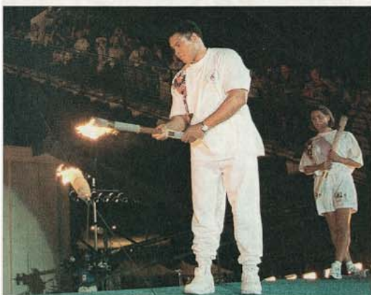
Ehre: Ali entzündet 1996 das olvmische Feuer in Atlanta.