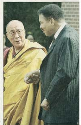
Seegen: Ali, Dalai Lama.