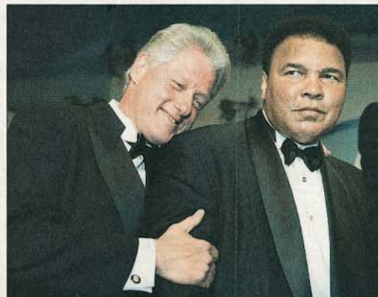
Macht: Ali mit dem ehemaligen US-Präsidenten Bill Clinton.