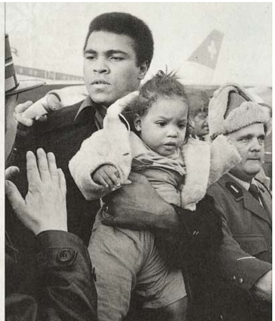
1971 in Kloten. Ali kassierte für den Auftritt in Zürich 300 000 Dollar.