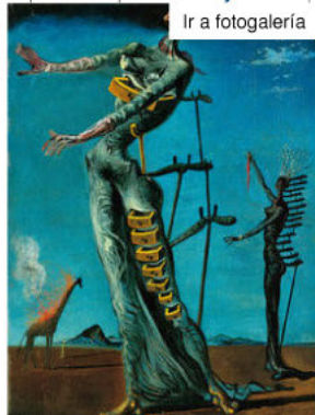
'Dalí, la obra pictórica', de la editorial Taschen Basle , Kunstmuseum Basel, Öffentliche Kunstsammlung. Copyright: Salvador Dalí, Fundació Gala-Salvador Dalí/ VG Bild-Kunst, Bonn 2013

El volumen incluye el primer cuadro que pintó a los 6 años , Paisaje (Vista de los alrededores de Figueras) , en 1910. Aunque a esa edad, Dalí de mayor lo que quería era ser "cocinera". A los siete años quería ser Napoleón, al que conocía de verlo en casa de unos vecinos argentinos en la etiqueta que estampaba un barrilete que contenía mate.